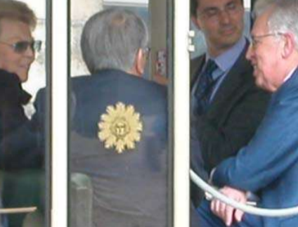
Jean-Claude Trichet, président de la Banque Centrale Européenne et ancien gouverneur de la Banque de France