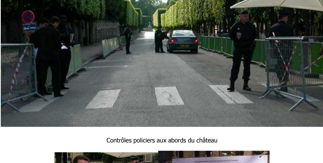
Contrôles policiers aux abords du château