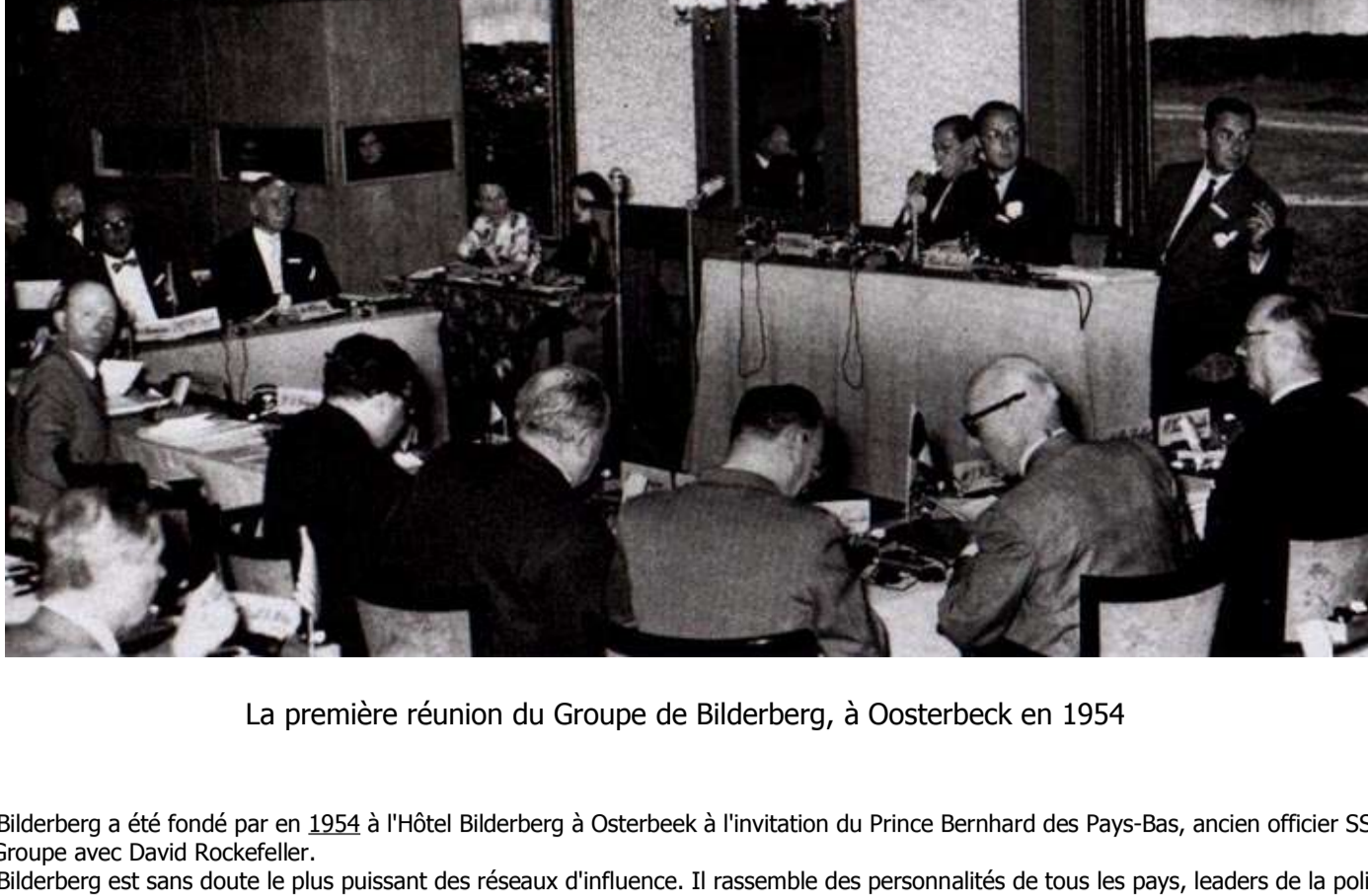
La première réunion du Groupe de Bilderberg, à Oosterbeek en 1954

Le Groupe de Bilderberg a été fondé par en 1954 à l'Hôtel Bilderberg à Osterbeek à l'invitation du Prince Bernhard des Pays-Bas, ancien officier SS, et co-fondateur du Groupe avec David Rockefeller.