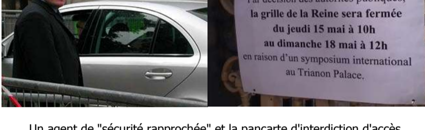
Un agent de "sécurité rapprochée" et la pancarte d'interdiction d'accès