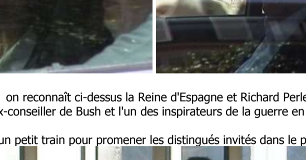
à gauche, Willy Claes, longtemps premier ministre en Belgique